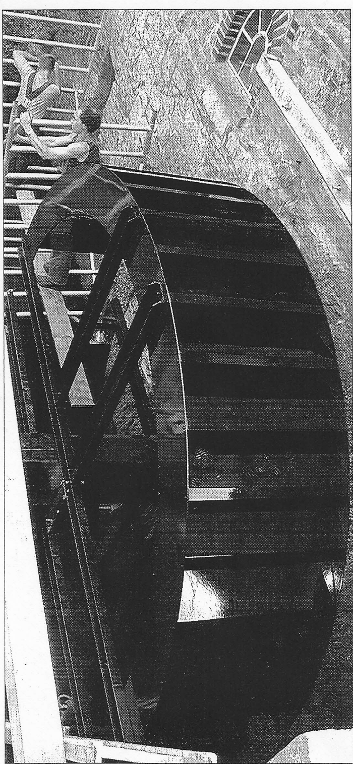
Klappert wieder: Holländische Fachleute erneuerten das Antriebsrad der Kükenbrucher Wassermühle.