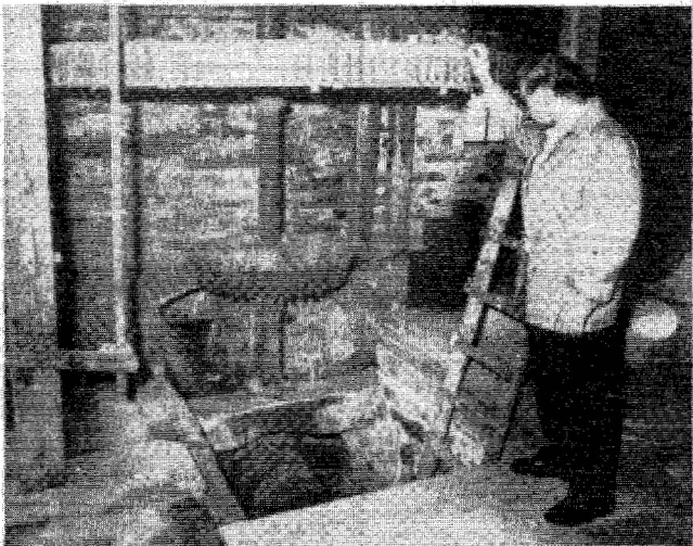
Extertal-Kükenbruch. Das völlig aus Holz bestehende Getriebe überträgt die Wasserkraft auf die Mühlsteine.

der das Mühlrad von Harkemissen nach Kükenbruch bringen wird. Vorher ist bereits die Metallwelle angeliefert worden, eine Spezialanfertigung aus Hannover.